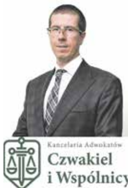
Kancelaria Adwokatów Czwakiel i Wspólnicy

Każda osoba, co do zasady, ma prawo rozporządzać majątkiem zgromadzonym w trakcie swojego życia. Może swobodnie dysponować nim zarówno za życia np. sprzedawać czy darować. Może również dokonać rozporządzenia majątkiem na wypadek śmierci.