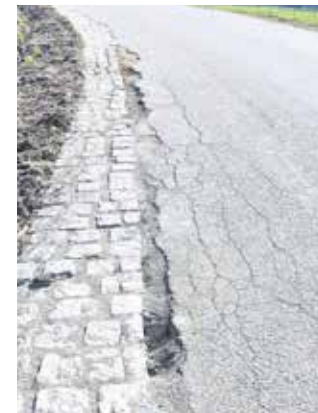
Droga Głuszyca - Sierpnica.

Po zsumowaniu wydatków wychodzi, że modernizacja tej drogi kosztowała ponad 3 miliony złotych i okazuje się, że w wielu miejscach wkrótce trzeba będzie ją znów remontować. Dlatego wysłaliśmy drogą mailową (na skrzynki służbowe) do starosty Krzysztofa Kwiatkowskiego i wicestarosty Iwony Frankowskiej pytania na temat stanu dróg w powiecie wałbrzyskim: Głuszyca – Sierpnica (która także była remontowana kilka lat temu i już w wielu miejscach wymaga naprawy) oraz drogi Grzmiąca – Rybnica Leśna: