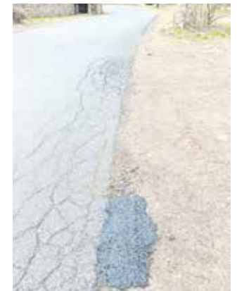
Droga Głuszyca - Rybnica Leśna.